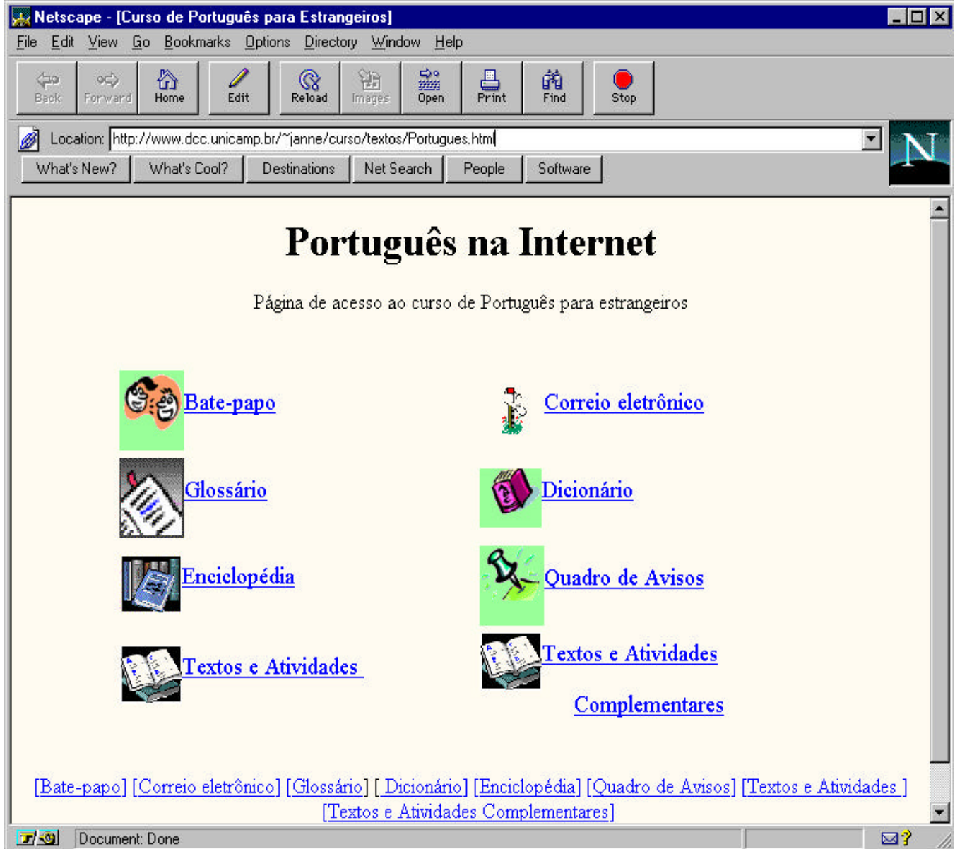
Página de Acesso ao Curso de Português